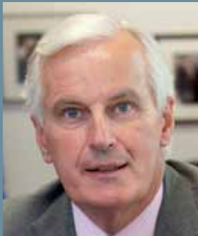
Michel Barnier Član Europske komisije nadležan za unutarnje tržište i usluge

Mobilnost kvalificiranih stručnjaka u Europskoj uniji ključan je izvor rasta. Zbog toga im je važno osigurati jednostavan odlazak u zemlje u kojima se nude radna mjesta. Novom se Direktivom jača okvir kojim se omogućuje brzo, učinkovito i pouzdano priznavanje stručnih kvalifikacija.