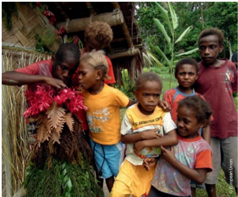
U državi Vanuatu djeca pomažu izgraditi maketu najveće prijetnje kojoj su izloženi, vulkana Mount Gharat.

Usmjerenišću Europske komisije na otpornost na ekonomičniji se način pridonosi daljnjem spašavanju života i smanjenju siromaštva, čime se povećava učinak pomoći i promiče održivi razvoj.