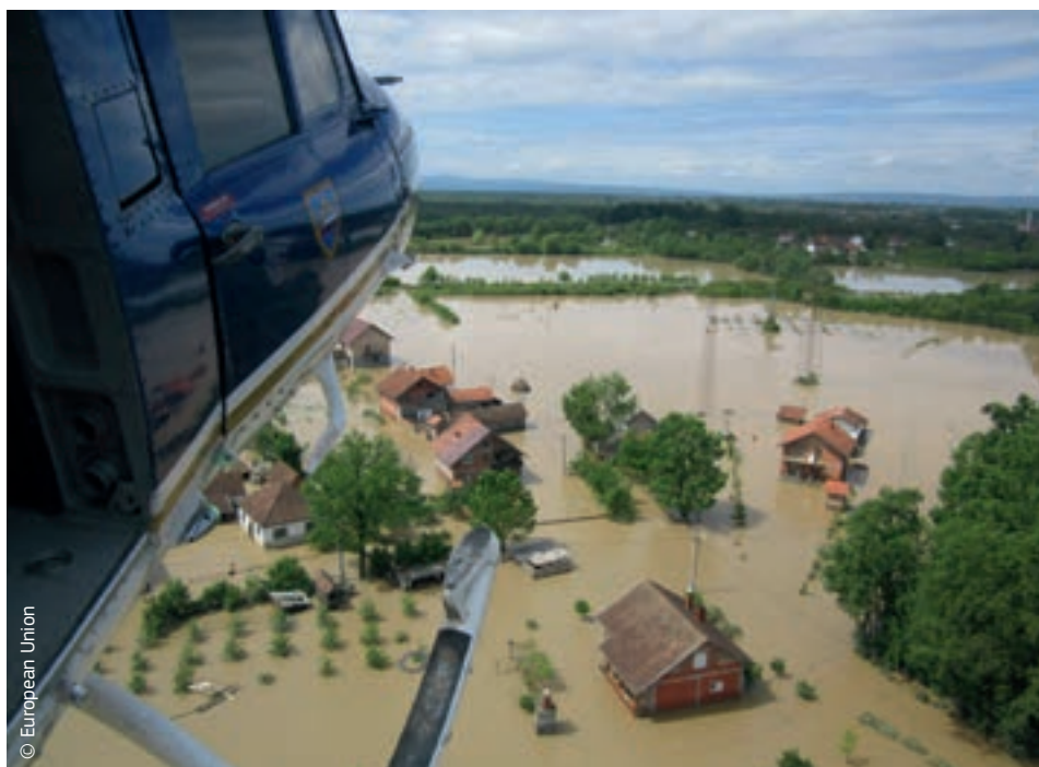
S pomoću mehanizma EU-a za civilnu zaštitu, slovenski helikopter pruža hitnu pomoć ljudima pogođenima poplavama u Bosni i Hercegovini.

Uz pomoć u naravi koju osiguravaju države članice EU-a s pomoću mehanizma EU-a za civilnu zaštitu, EU je dodijelio i dodatnih 3 milijuna EUR u obliku humanitarne pomoći namijenjene najugroženijim osobama u dvije pogođene države. Iz tih se sredstava osigurala humanitarna pomoć za pola milijuna ljudi. Unatoč tomu, obje zemlje i dalje imaju velike potrebe povezane s oporavkom i obnovom.