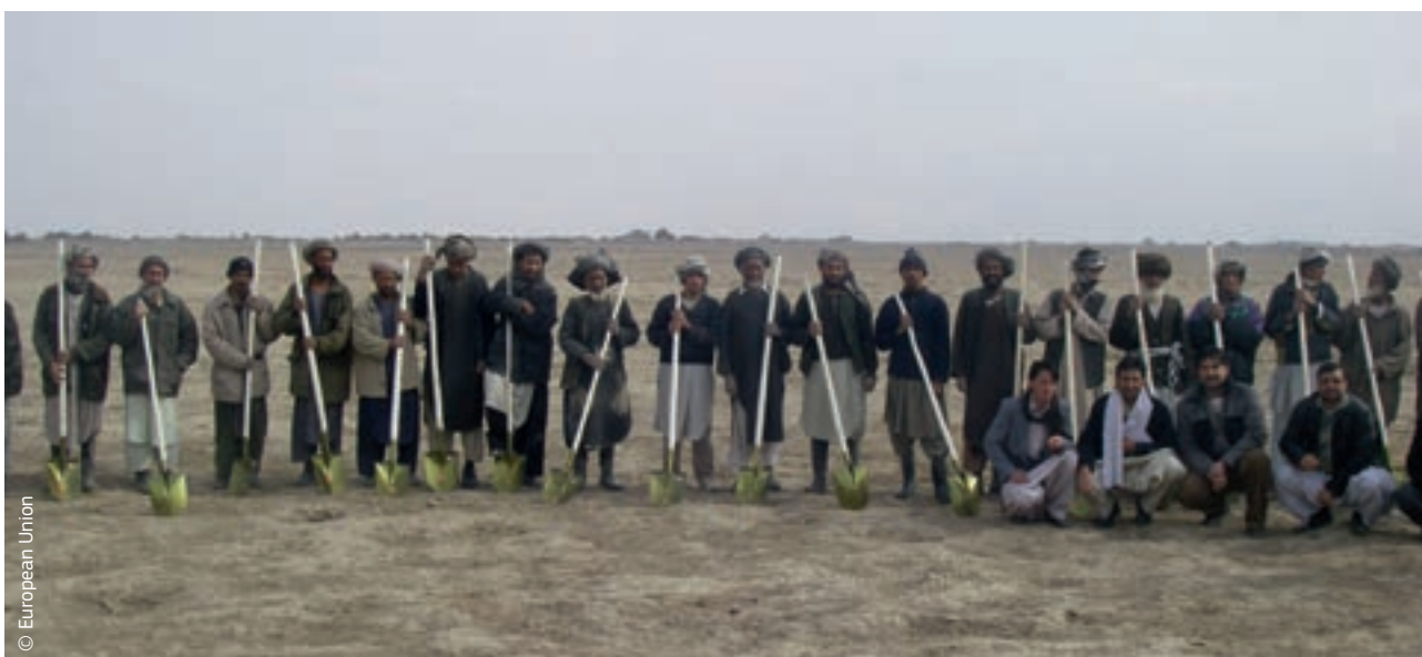
Afganistanci s alatima financiranim iz programa ECHO u okviru odgovora na sušu koja je uzrokovala glad i raseljenost.

Institucije EU-a i tadašnjih 27 država članica usuglasile su se 2007. oko ključne politike pod naslovom „Europski konsenzus o humanitarnoj pomoći“. U njoj se naglašava da humanitarna pomoć EU-a nije političko sredstvo i potvrđuju se vodeća načela humanitarne pomoći: humanosti, neutralnosti, nepristranosti i neovisnosti.