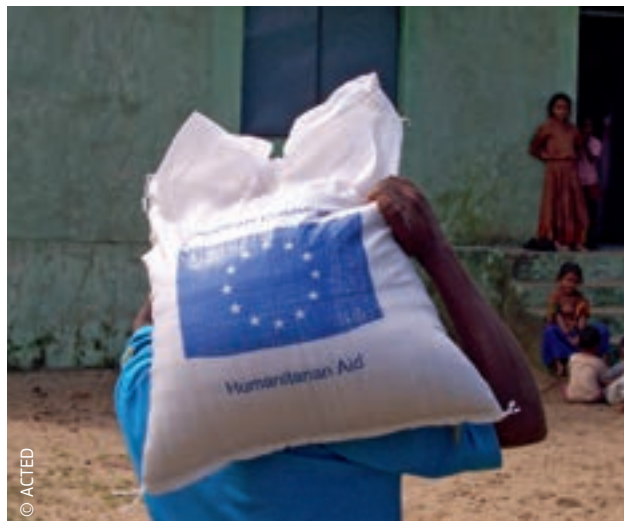
EU financira humanitarnu pomoć u Indiji od 1996.

Mehanizmom EU-a za civilnu zaštitu državama sudionicama pomaže se u pogledu sprečavanja katastrofa i pripravnosti za krizne situacije te prikupljanju sredstava koja se zatim stavljaju na raspolaganje u svrhu usklađenog i brzog odgovora u pogođenim zemljama. Dok je humanitarna pomoć EU-a uglavnom namijenjena državama izvan EU-a, mehanizam se u hitnim slučajevima može iskoristiti i unutar i izvan EU-a. Mehanizam EU-a za civilnu zaštitu sredstvo je kojim se jača europska suradnja. Državama članicama služi kao potpora civilnoj zaštiti na nacionalnoj, regionalnoj i lokalnoj razini jer nudi učinkovita sredstva za sprečavanje prirodnih katastrofa i nesreća izazvanih ljudskim djelovanjem, kao i pripremu i odgovor na njih. Rezultat je tog komplementarnog i pojednostavnjenog okvira u EU-u povećanje kapaciteta odgovora i koordinacije te bolja uporaba resursa.