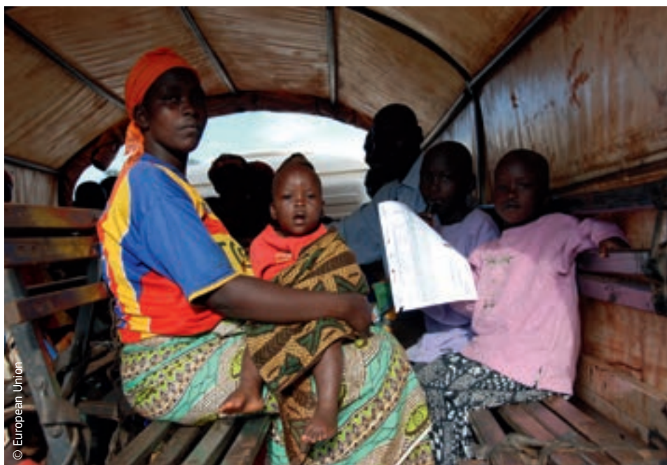
Prethodno raseljena burundijska obitelj mogla se vratiti u svoj dom zahvaljujući potpori EU-a za povratak.

Kako bi se upravljalo dugoročnijim učinkom katastrofa i poboljšale mjere sprečavanja i pripravnosti, humanitarna pomoć i odgovor na krizu moraju ići ukorak s aktivnostima u drugim područjima, uključujući područje razvojne suradnje i zaštite okoliša. Zbog toga je suradnja na razini EU-a iznimno važna.