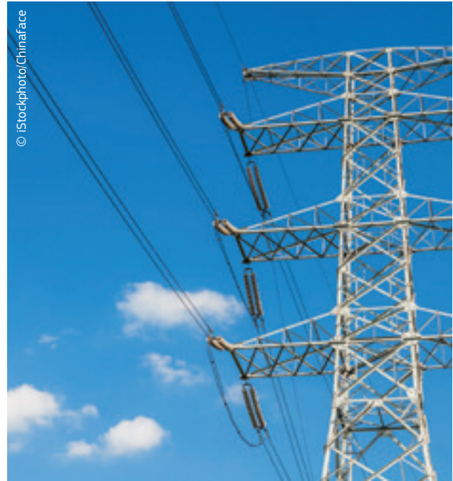
Potrošači mogu birati između brojnih dobavljača energije u Europi.

Komisija može pristati da tvrtka ima monopol u posebnim okolnostima, primjerice, ako se radi o skupoj infrastrukturi („prirodni monopoli”) ili kada je važno jamčiti javnu uslugu. Međutim: