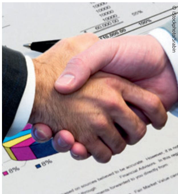
Sporazumi između tvrtki ponekad mogu ograničiti konkurenciju.